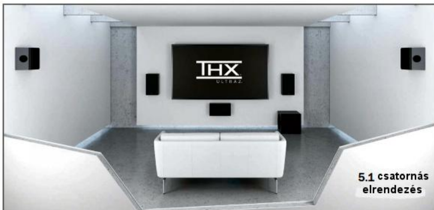
5.1 csatornás elrendezés

Kis méretének és a számtalan elrendezési lehetőségének köszönhetően a Cinema Ultra házimozzi rendszer sokféleképpen alakítható ki. A THX® már hivatalosan is engedélyezte az 5.1 csatornás legkisebb kialakítást (balra fent), de sok filmbarát nyilvánvalóan ennél nagyobb rendszerre vágyik. Egy második mélynyomó még több mélyet ad a rendszerhez, a hátsó dipól térhangsugárzókkal, vagy akár egy második pár frontszugárzóval a hallgató mögötti térben igen látványos hanghatásokat elérő 7.2 csatornás rendszer alakítható ki (a középső képen mutatunk egy ilyen elrendezést).