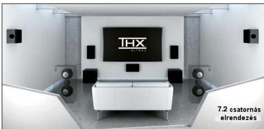
7.2 csatornás elrendezés

A rugalmasan elhelyezhető frontszugárzóknak köszönhetően a THX® Ultra2 nagyon praktikus is kialakítható: a három fekvő frontszugárzóval kis helyen is impozáns hangzást biztosító módon alakíthatóak ki a frontcsatornák, akár a legnagyobb TV-készüléknek, a nagy vetítőképernyőnek és a készülékek elhelyezésére szolgáló szekrénynek, vagy állványnak is helyet adva (lásd az alsó képen).