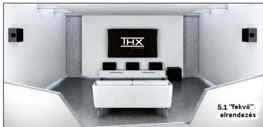
5.1 "fekvő" elrendezés

A THX és a THX logó a THX Ltd. USA-ban és egyéb területeken bejegyzett védjegye. Minden jog fenntartva!